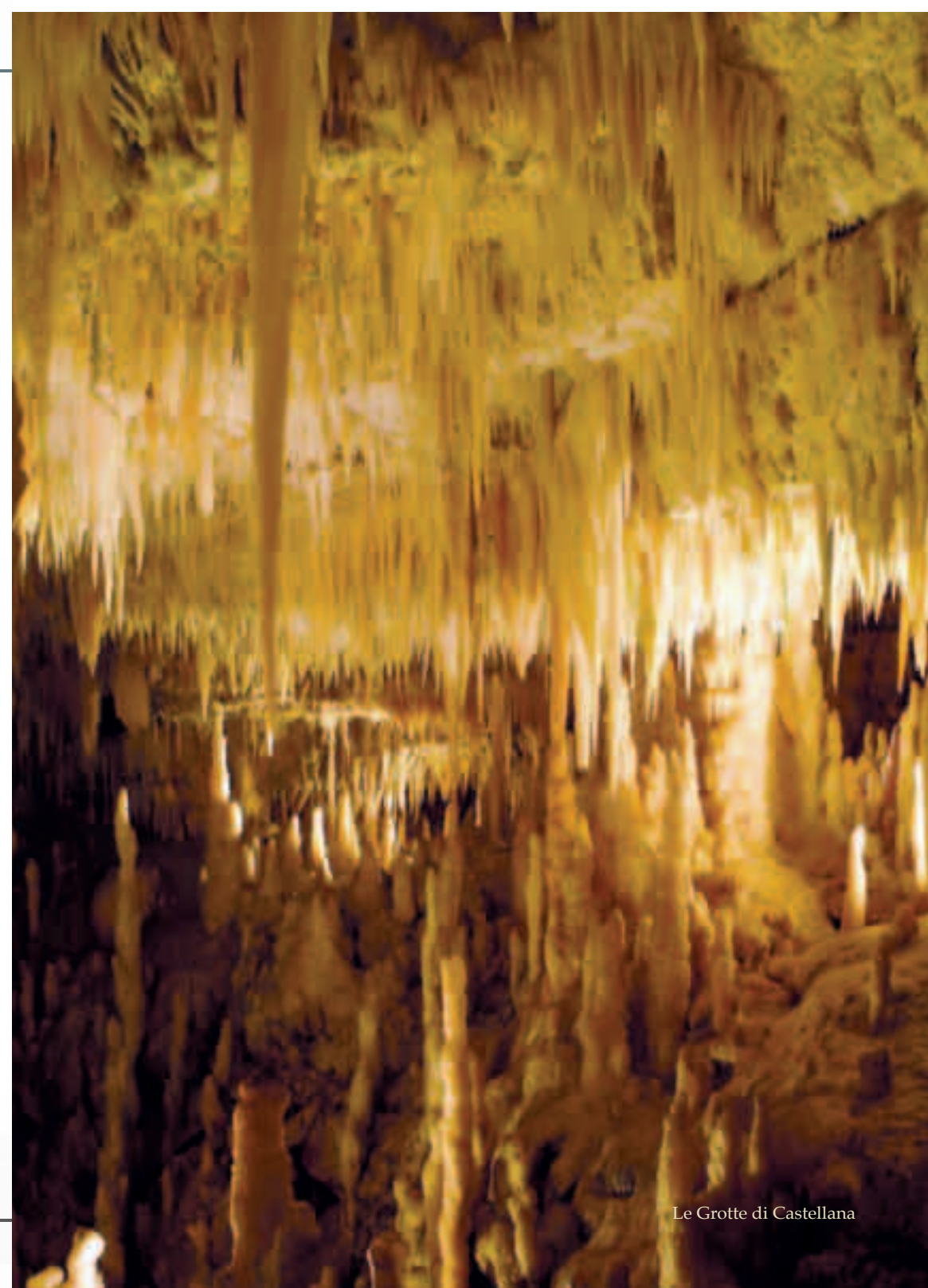
Le Grotte di Castellana