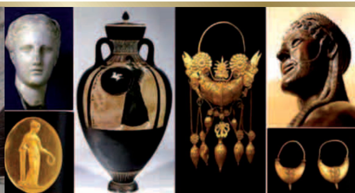
Taranto. Museo della Magna Grecia. Reperti Archeologici.