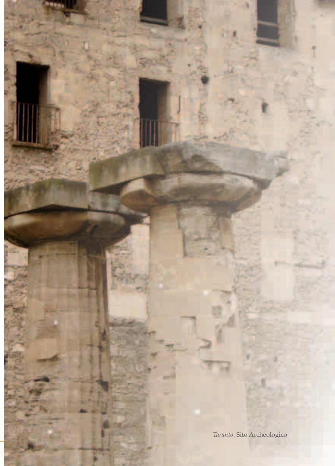
Taranto. Sito Archeologico