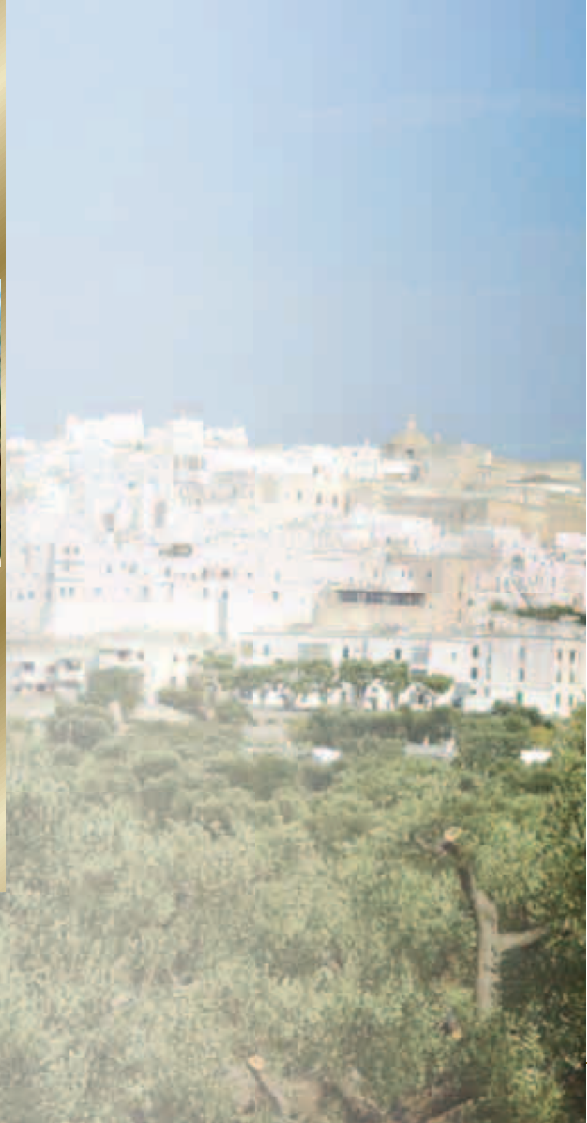
Sfondo: Panorama di Ostuni In ordine dall'alto: i trulli; un uliveto; la costa merlata