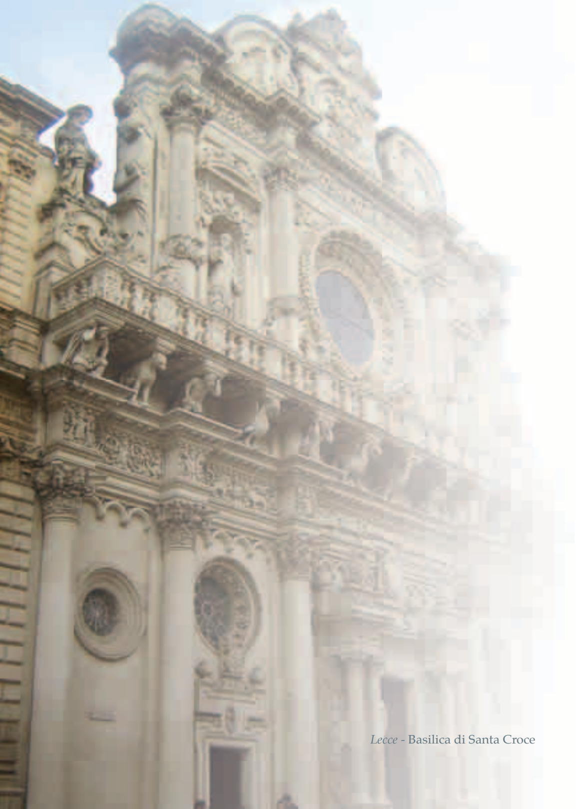
Lecce - Basilica di Santa Croce