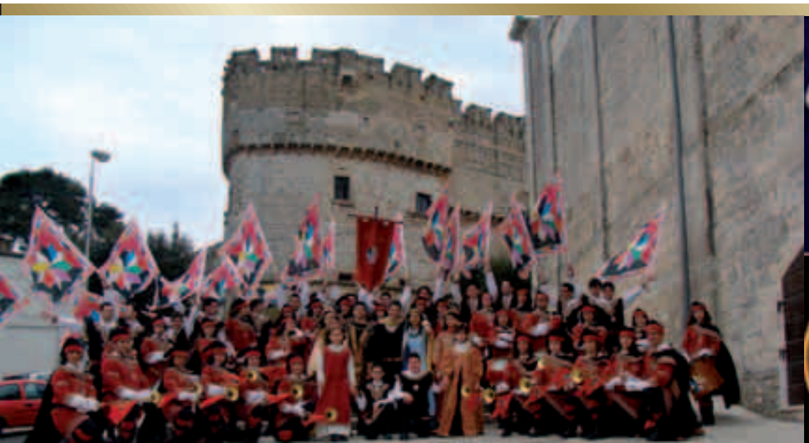
Carovigno. Castello Dentice di Fasso e sbandieratori